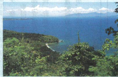
11-12月 フィリピン共和国 ミンドロ島