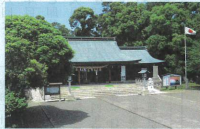
5-6月 御祭神 65,000余柱・熊本縣護國神社