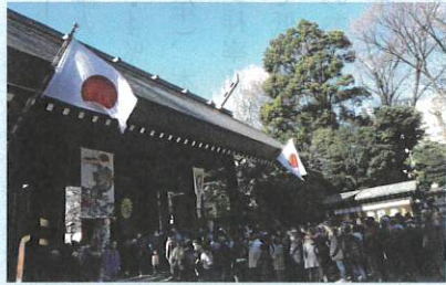
1-2月 靖國神社初詣風景