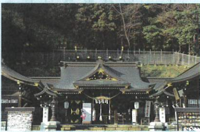
9-10月 御祭神 68,500余柱・福島縣護國神社