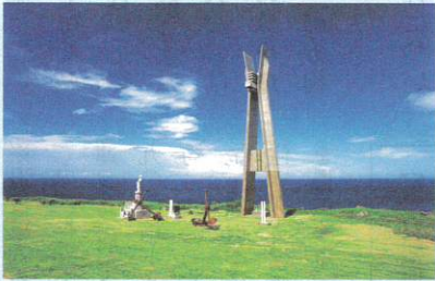
3-4月 戦艦大和慰霊塔(鹿儿岛県大島郡伊仙町)